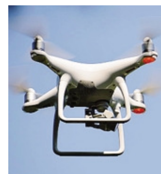
Un drone in volo