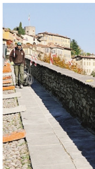
Il cantiere a San Giacomo ZANCHI

Durante gli interventi passati alcune «copertine» dei parapetti erano state sostituite con nuove lastre, sollevando critiche di molti, compreso il critico d'arte Vittorio Sgarbi. Ora sul viadotto è stata applicata una modalità di lavoro al 100% conservativa.