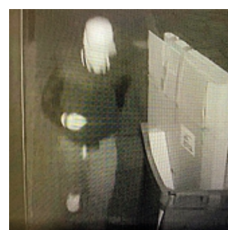
Intruso ripreso dalle telecamere