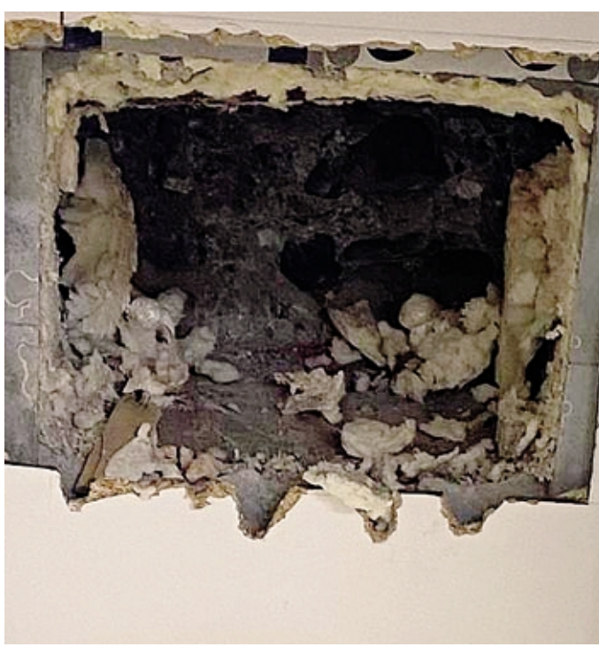
La cassaforte sradicata dal muro in occasione di uno dei furti